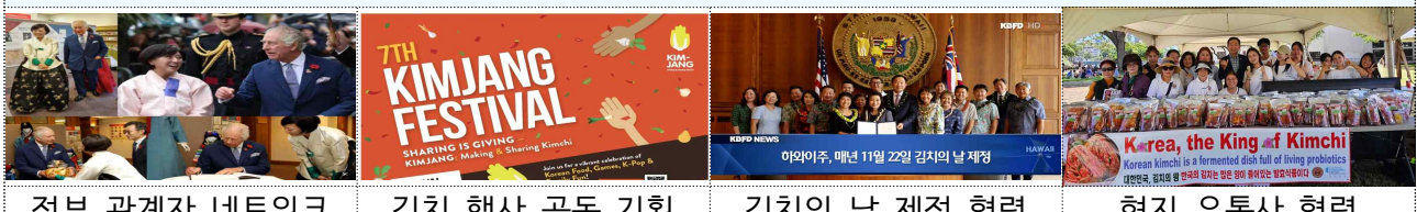
정부 관계자 네트워크