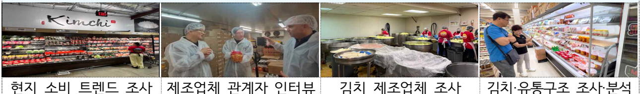
현지 소비 트렌드 조사