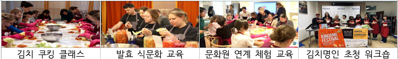
김치 쿠킹 클래스